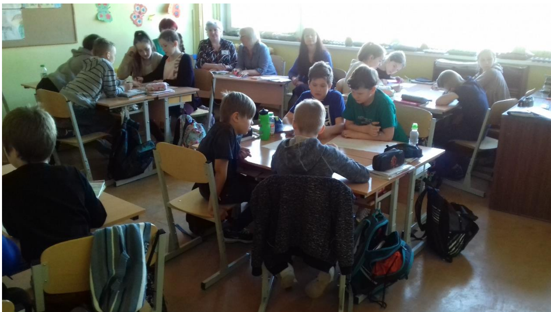
Stundas uzdevumu skolēni veic strādājot grupās.